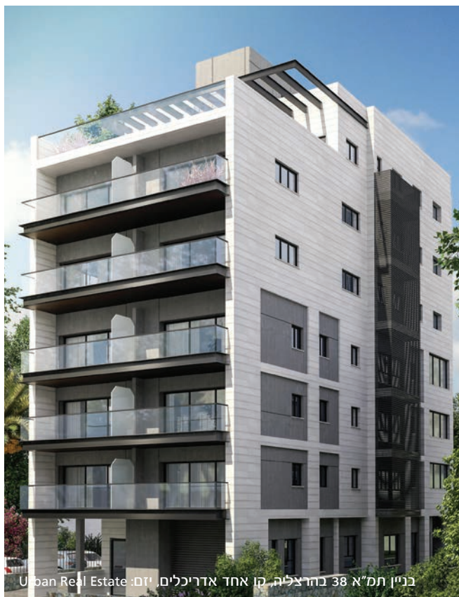
בניין תמ"א 38 בהרצליה, קו אחד אדריכלים, זום: Urban Real Estate

אריחי חיפוי דגם 'אופק' של אקרשטיין מיוצרים בטכנולוגיה מתקדמת בכבישה בלחץ גבוה ובקרת איכות קפדנית. האריחים מיוצרים בהתאם לתקן ישראלי 1872 חלק 1: חיפוי באבן מלאכותית: יחידות אבן מלאכותית.